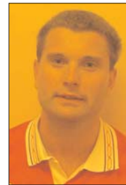
Mattans mål kom som ett brev på posten. 2-2!

I den 30:e åker så mungiporna upp igen, då vi i en riktigt tillkrånglad situation har minst elva man inne på Hagalundsmållinjen och till sist får in den i maskorna.