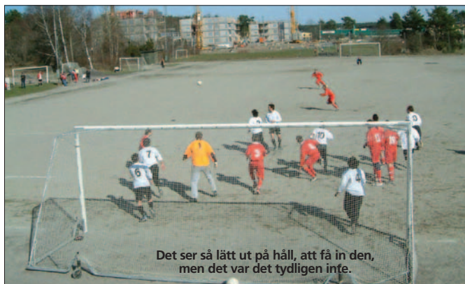
Det ser så lätt ut på håll, att få in den, men det var det tydligen inte.

Sen fick Zacco gult för att ha petat på mållisen, vilket inte många såg och för att kompensera för detta kort