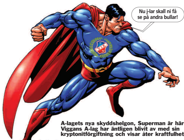
A-lagets nya skyddshelgon, Superman är här! Viggans A-lag har äntligen blivit av med sin kryptonitförgiftning och visar åter kraftfullhet.

2-0 mot Bele Barkarby och vi är med igen