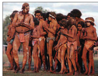
"Kom så bjuder vi på bira!"

Men då kom en massa solbrända killar ner och tog pinnarna ifrån oss och sa att vi skulle följa med dom upp i skogen, så skulle vi få en bira. Sk-tsnack tänkte jag. Inte bjuder dom där på bira."