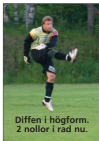
Diffen i högform. 2 nollor i rad nu.

I den andra halvlekens 4:e minut lägger Gylfen upp