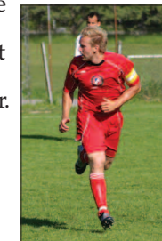
Dagens skräll: Krutov Captain!!!

När Viggan mötte Hässelby var det svettigt. Men Viggan inledde starkt och Clådde hade första chansen i den 7:e, efterföljt av lille