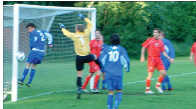
Så här nära var det att Tunas hörna gick in i den 25:e. Tuna var rågrym i första halvlek.

Tuna rusar från halva plan och från ca 30 meters håll avlossar han en ormdödare, som smiter in vid målvaktens högra stolpe. 1-0!