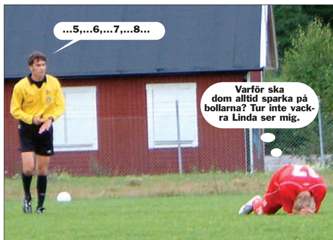
Billes nedräkning får symbolisera Viggans bittra torsk mot Bele B-by.