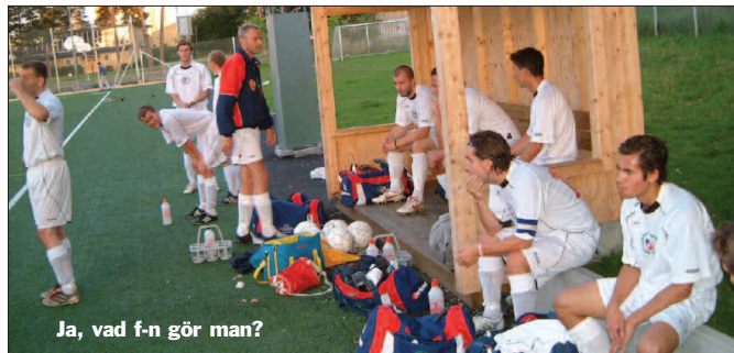
Ja, vad f-n gör man?

Sen hände inte så mycket mer annat än att dom gjorde