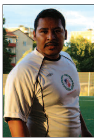
Il Bisone Henrysson efter matchen: "Dé é inte så ja lätt som det låter!"

Mer att läsa om matcherna och annat smågodis finns inne i bladet. □