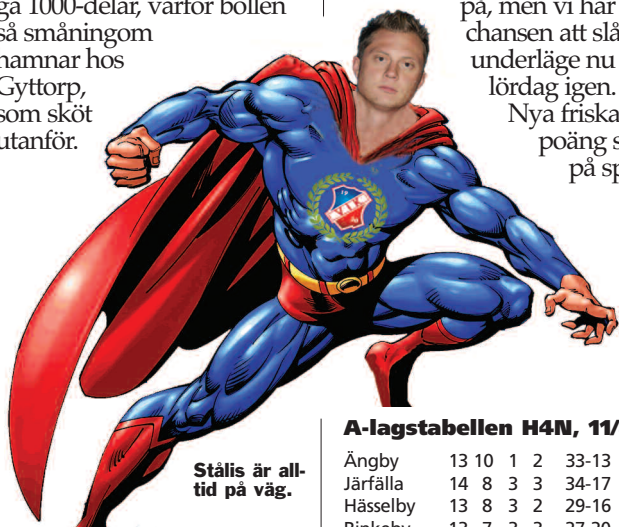
Stålis är alltid på väg.

I den 27:e slår Gylfen en diagonalt öppnande passning som ställer Tuna helt fri, men han fick bollen på stödjebenet och tappar viktiga 1000-delar, varför bollen så småningom hamnar hos Gyttrorp, som sköt utanför.