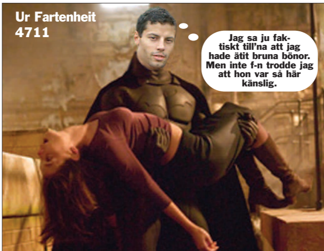
Ur Fartenheit 4711

Det lär säkert förekomma inom filmindustrin också, men inom fotbollens omklädningsrums väggar vet vi att det förekommer. Vi manar därför samtliga till varsamhet med naturkrafterna för allas säkerhet.