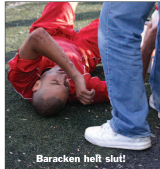
Baracken heft slut!

Zaccou inte fick straffar när dom fälldes men att Tissarna föll mot Rinkeby i går kväll med 6-1 lindrar lite. Nu är vi nära en trepoängare. Låt oss ge Turebergarna på tansen för vad dom gjorde i går kväll mot Bilagan. □