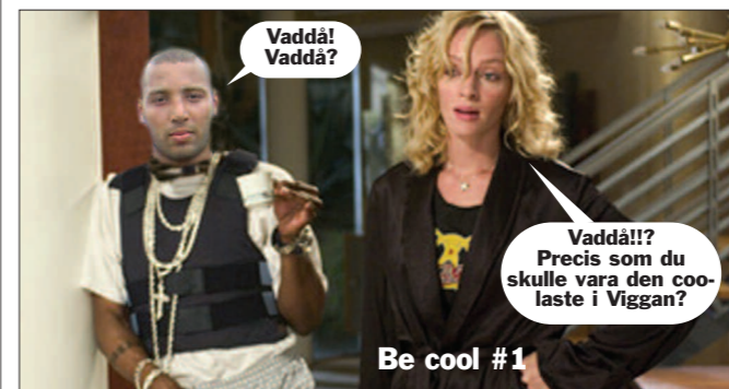
Be cool #1