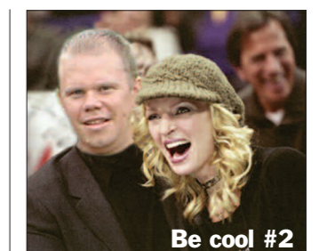
Be cool #2

- Aaaaaj! Krille för h-e, du får inte nypa så hårt i häcken! - Jamen de é ju inte jag ju!