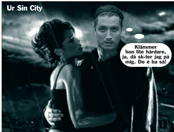
Ur Sin City