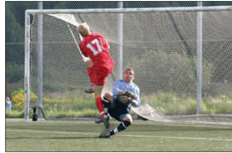
Bille solo med mållisen redan i den 2:a i 1:a.

I den 37:e visar Bille sitt blanka garnityr och trots att han fyra gånger pressas ner av diverse Rinkisar reser han sig och gör bort dem tills han helt slut får iväg ett närskott på mållisen som dock tas. En prestation utöver det vanliga.