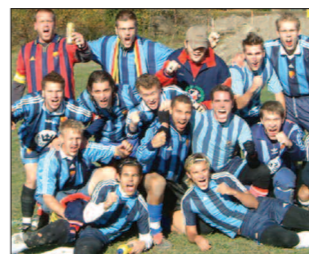
Förra årets vinnare: Djurgårdens IF!!

Lördagen den 8 oktober spelas Lilla Viking Cup. Som vanligt samlas alla lagen i sina respektive matchkläder på Hägernäs IP kl 11.00. Varje lag anmäler en lagledare som ansvarar för resp lag. Anmälningsavgiften är som vanligt 50 kr per anmäld deltagare, vilket inlämnas av resp lagledare senast lördag 1 oktober.