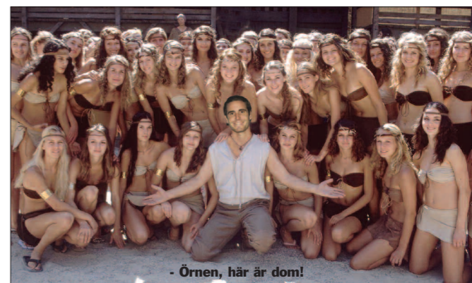
- Örnen, här är dom!

Här ser vi två trogna gossar som alltid är redo att ställa upp och göra grovjobb. Senast i matchen mot IFK hade dom blåstället på hela matchen, vad vi vet. Päminner dom förresten inte lite om två filmkändisar?