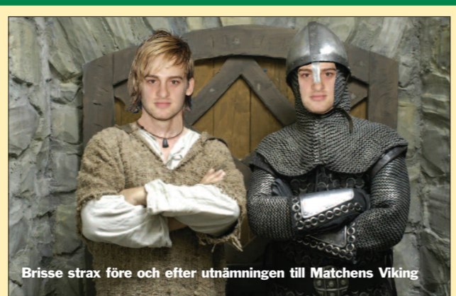
Brisse strax före och efter utnämningen till Matchens Viking

HBK tvingas till en dubbelräddning i 80:e men i den 87:e är Zaccou ytterst nära att avgöra med ett avancerat perspektivskott som vrider sig utanför bortre krysset. Seg match, men en pinne. □