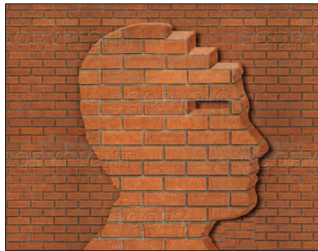
Mannen på bilden, som ofta brukar gå på Bruket, önskar förmodligen att vara anonym, liksom vi

Till saken hör att den som bjöd högerbacken på en Long Island, hade som inteckning, fått löfte om fri