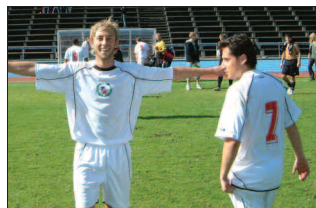
Lätt för dej att vara glad!