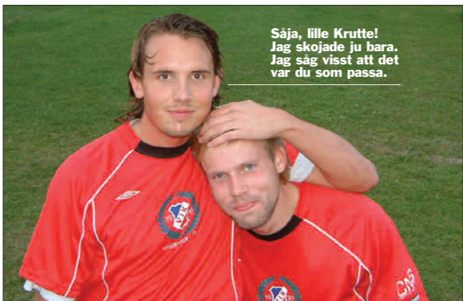
Såja, lille Krutte! Jag skojade ju bara. Jag såg visst att det var du som passa.

Då det inte fanns något mer på Örnens papper är det läge att avsluta. Jag tror många i laget var nöjda med poängen. En hård match avslutades med att domaren blåste sönder de sista 10 minuterna. Hade matchen varit ca 20 minuter längre, hade vi nog fått håll på dem en gång till. Det verkade