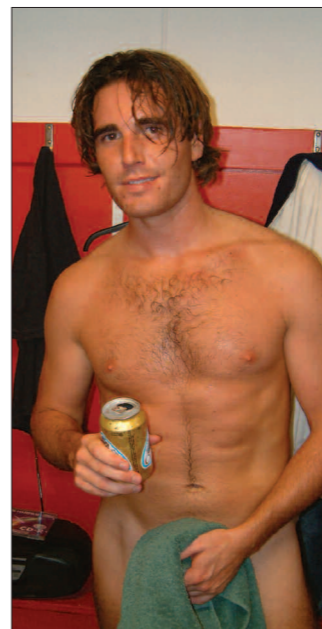
Von Richthofen med pillerburk?