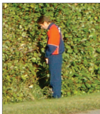
Äre Nisse Piss? Näe, Nisse Puff!

Ja, sen tog matchen slut och alla närda förhoppningar lämnades kvar i Mälardalen. Sammanfattningsvis kan man säga att under de första 15 minuterna i första halvlek var vi riktigt bra och borde också rättvist ha tagit ledningen. Andra halvlek var vi värda ett bättre öde, då vi understundom dominerade.