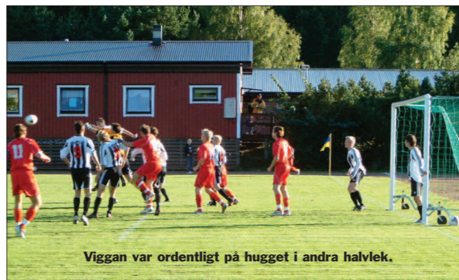
Viggan var ordentligt på hugget i andra halvlek.

Viggan trycker på hårt nu och i den 37:e så gör Viksjö