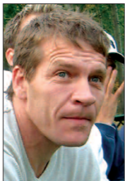
"Jag kan väl för f-n inte rå för att han fastna i min hand, eller!?"

för länge, Gonzalo de Brazil (ICA Kvantum till vardags) som nästan lyckades att cykla in 1-0 tidigt i matchen. Gonne slet och det var kul att se. Särskilt då MoDo under hela säsongen har haft ett flertal "Far-och-son" möten.